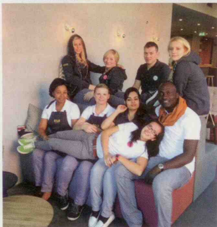
»Weniger ist mehr« – nach dieser Devise sind die durchgestylten Zimmer und Bäder eingerichtet; in Verbindung mit dem jungen Team soll so eine familiäre und offene Atmosphäre im Design-Budgethotel verbreitet werden